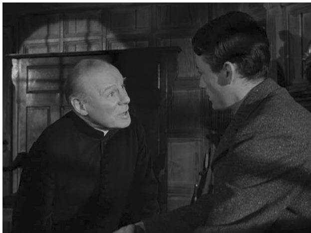
Biskup Mack Nabb vždy veril, že vo svojráznom Francisovi sa ukrývajú nevšedné schopnosti

Francis odišiel do svojej izby, bledý, roztrasený. Mal pred sebou debnu so športovými potrebami, ktorá prišla od priateľa pošťou. Teraz už bola nepotrebná, zakázaná. Myslel tuho. Nemôžem sa poddávať, musím bojovať, a to nie za seba, lež za túto ubiedenú farnosť, ktorú mi Boh zveril ako prvý. V nasledujúcich dňoch sa pokúsil ešte vyjednávať s Kezerom, ale čím viac sa o to snažil, tým bol odpor farára neochvejnejší. Vo Francisovi sa však zrodila nová odvážna myšlienka. „Musím to aspoň skúsiť,“ hovoril si.