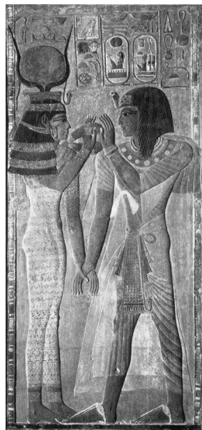
Jozef s manželkou Asenat

Jozefov príbeh svedčí o snahe svätopisca včleniť vieru v jediného Boha do svetového kontextu. Mnohé starozákonné knihy pre podobné zmýšľanie toleranciu nemajú. Skôr v nich vo vzťahu k pohanom badáme netoleranciu. Vykreslenie Jozefovej integrácie do pohanského prostredia má ukázať, že Sväté Písmo má aj prúdy tolerancie voči pohanom a snahy prenikať do neizraelského prostredia.