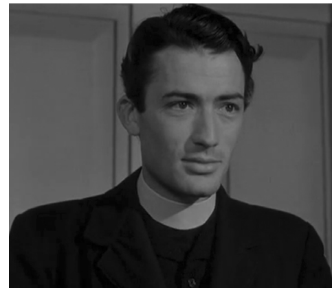
Francisa Chisholma vo filmovom spracovaní Croninovho románu stvárnil Gregory Peck

Ako sa ukázalo, s duchovným otcom Kezerom naozaj nebolo ľahké vyjsť. Bol od prírody popudlivý, náchylný k hrubostiam. To, že sa mu nepodarilo získať náklonnosť svojho stáda, zatvrdilo ho na kameň. Raz síce dostal dobrú faru, ale i tam bol taký neoblíbený, že niekoľko vplyvných ľudí požiadalo biskupa, aby ho preložil. Spočiatku to niesol veľmi ťažko, no neskôr o tom začal hovoriť ako o vlastnom hrdinstve: „Zostúpil som dobrovoľne z trónu na zem...“ Jeho kuchárka a gazdina slečna Caffertyová jediná s ním vychádzala dobre.